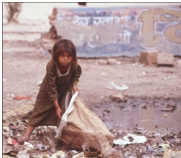
Een straatmeisje zoekt naar afval in de sloppenwijken van India.

"Straatkinderen worden als grofvuil behandeld"