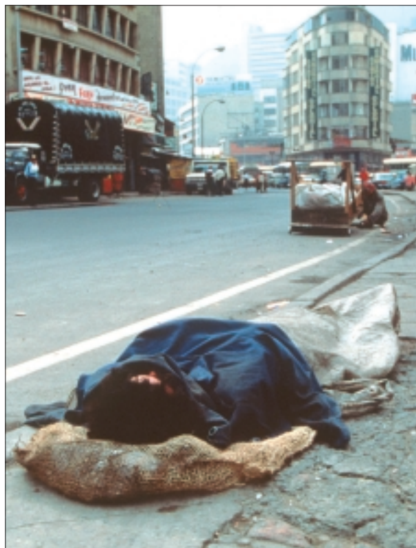
Een kind ligt te slapen op de straat in Bogota, de hoofdstad van Colombia. Er leven naar schatting 5000 kinderen op straat in Bogota.

"Ongeveer 120 miljoen kinderen tussen 6 en 11 jaar kunnen nooit naar school"