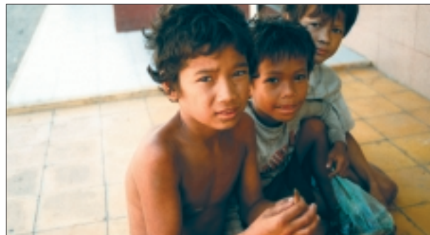
Deze jongens uit Cambodja leven op straat. Help jij ze een thuis te vinden?

Laat je creativiteit erop los, dan kun je zelf vast ook nog een hoop verzinnen!