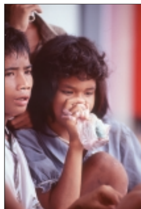
Om hun ellendige omstandigheden te vergeten, gebruiken veel kinderen drugs. Zo ook dit meisje in Cambodja.